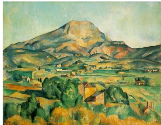
Cézanne: Montagne Sainte-Victoire