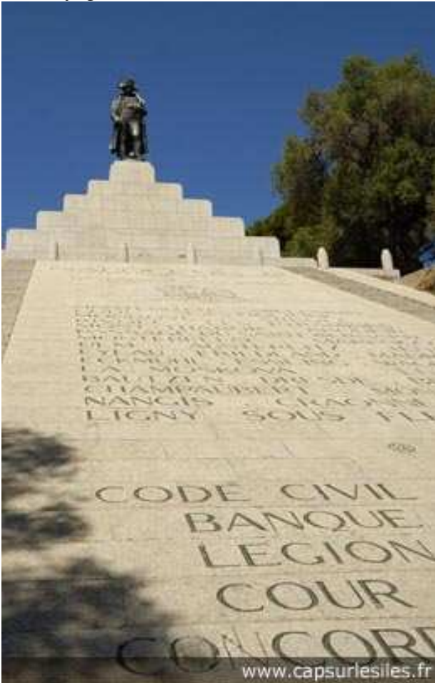
Napoléon à Ajaccio