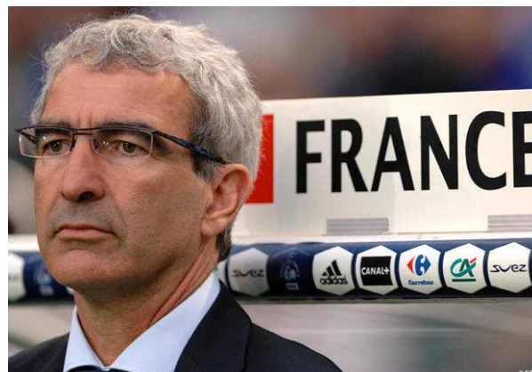
L` entraîneur Raymond Domenech

Non ! Nous ne sommes pas obligés de parler de foot en ce moment... Mais si on regarde vers la France... On ne peut pas ne pas voir la crise du football français depuis des semaines, des mois, que dis-je ... depuis des années. Vous me direz, on n’est pas forcé de regarder les joueurs, mais lorsque la politique s’en mêle en les personnes de Nicolas Sarkozy, Roselyne Bachelot, Rama Yade – ministre des sports, tous les Français pour ou contre le foot en parlent, les Allemands, les Européens, le monde. « Quelle honte pour la France ! »