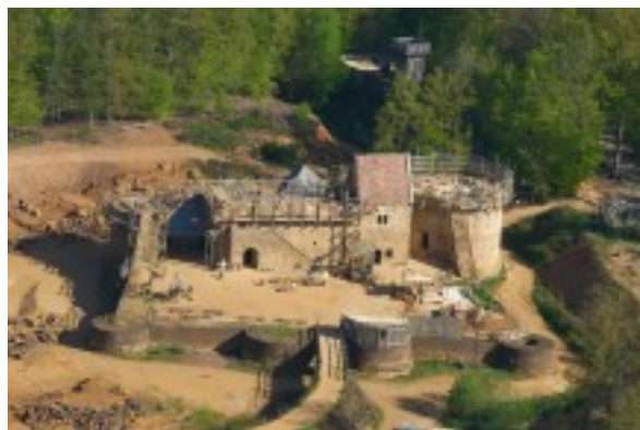
Luftbild von Guédelon 2008