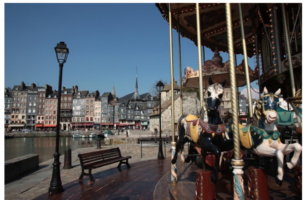
Historischer Hafen von Honfleur (Normandie)