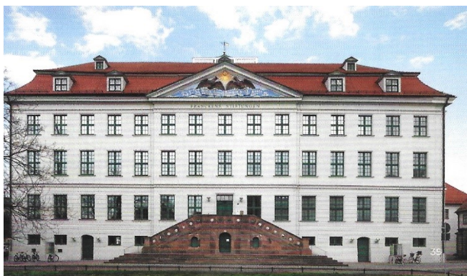
Historisches Waisenhaus Franckesche Stiftungen

Der Samstag begann mit einer Einführungsveranstaltung im „Historischen Waisenhaus“ der Franckeschen Stiftungen. Im Mittelpunkt wieder zahlreiche Ansprachen, musikalische Beiträge und ein Podiumsgespräch zur thematischen Einführung zum Kongress: „Kritischer Blick auf die deutsch- französische Zusammenarbeit für Europa in einem veränderten gesellschaftlichen und politischen Umfeld.“