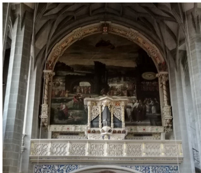
Orgel der Marktkirche

Der Sonntag begann mit einer Präsentation der Ergebnisse der Ateliers an vier verschiedenen Stationen und wurde mit einer festlichen Abschlussveranstaltung fortgesetzt. Das Ganze wurde erneut musikalisch umrahmt, u.a. vom Städtischen Singschor zu Halle, dem ältesten Knabenchor Deutschlands, wie wir erfuhren sowie durch einen Festvortrag: „Der Vertrag von Aachen – Gegenmodell zu mein Land first“ .