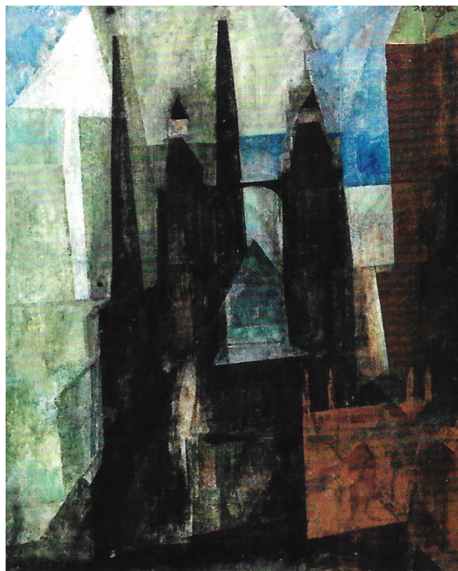
Lyonel Feininger, Marienkirche mit dem Pfeil, 1930