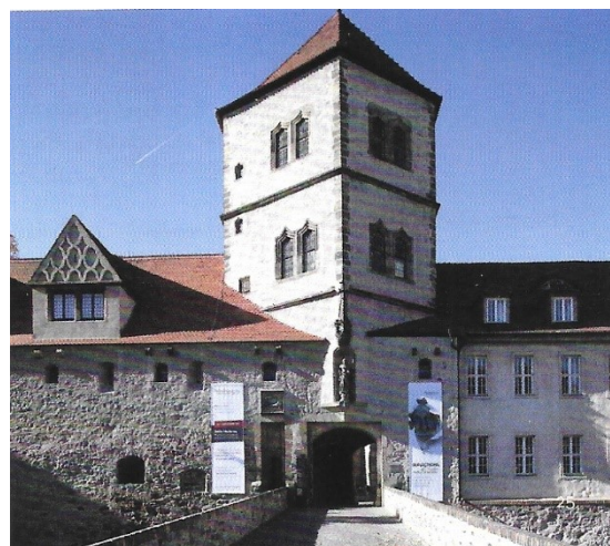
Kunstmuseum Moritzburg, Torturm