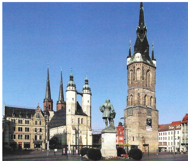
Marktplatz mit Marktkirche, Händel- Denkmal und Rotem Turm

Am Samstagabend wurde dann zu einem einstündigen Orgelkonzert (auf zwei historischen Orgeln) in die Marktkirche eingeladen, bevor wir mit einer Sonderfahrt per Straßenbahn nach Halle-Kröllwitz zu einem deutsch-französischen Begegnungsabend mit Grillbuffet ins historische Restaurant „Krug zum grünen Kranze“ am Saaleufer gegenüber der Burg Giebichenstein gebracht wurden. Dort fand sich genügend Gelegenheit, auch mit den französischen Teilnehmern ins Gespräch zu kommen.