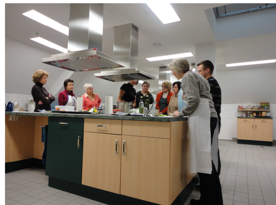
Kochen im Tietz

Gegen 18 Uhr begann das gemeinsame Essen (und Trinken). Bald sendeten unsere Mägen das Signal „satt“, aber tapfer wurde alles aufgegessen. Nach Abwasch und Aufräumen, mit Rezepten ausgestattet, sehr satt und um einige Erfahrungen reicher gingen alle nach Hause.